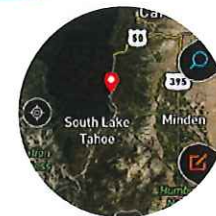
【衛星画像】 写真でリアルな現地状況の把握に