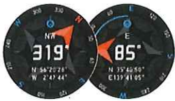
方位 / ペアリングメモリー