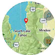
【アウトドア】 高低差などの確認に