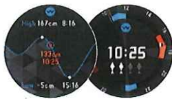
タイドグラフ / フィッシングタイム