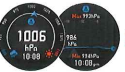
気圧 / 気圧グラフ