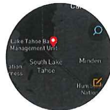
【ダーク】 おおまかな地勢の把握に