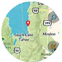
【ストリート】 都市部での移動に