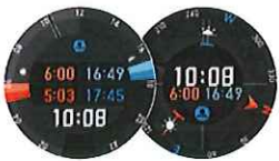
日の出・日の入り時刻 / 日の出・日の入り方位