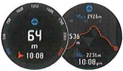
高度 / 高度グラフ