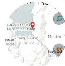
【ライト】 明暗で見やすい表示に